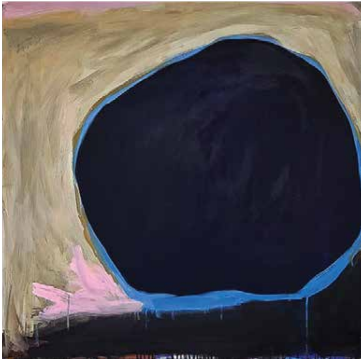
SEM TÍTULO 2018 Acrílica sobre tela 100x100x3cm