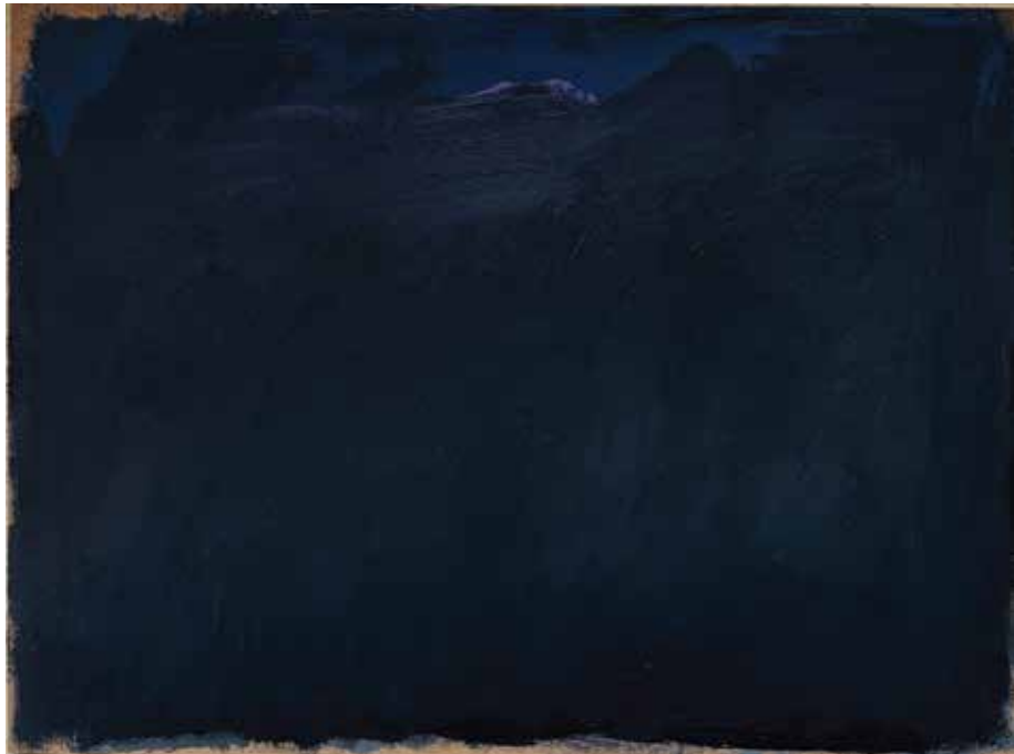
SEM TÍTULO, 2019. Guache em mdf, 30x40 cm

Filho de pais imigrantes vindos da Rússia e Polônia, estudou medicina e sempre teve a arte como fio condutor da vida, tanto na medicina como na pintura que vem desenvolvendo ao longo de 25 anos. Possui obras em Acervo da Galeria Virgílio, São Paulo. Estudou desenho com Carlos Fajardo, fez curso de escultura em cera na National Academy School of Fine Arts, NY e no Centro de Artes de São Paulo com Jean Algarotti. Estudou pintura com Marco Giannotti e Paulo Pasta. Ganhador do prêmio - The 31th Chelsea International Fine Art Competition. Realizou 02 Exposições individuais na Galeria Virgílio, São Paulo. Exposições Coletivas na Galeria Virgílio, no Instituto Tomie Ohtake, no Cultural Blue Life e Bienal de pintura na Galeria Virgílio, São Paulo.