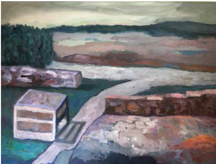
CONSTRUÇÃO 2, 2018. Óleo sobre tela, 100x130 cm (detalhe)

Formou-se em economia pela PUC-RJ tendo desde cedo ingressado no universo das artes plásticas. Ainda no Rio de Janeiro, frequentou a Escola de Artes Visuais do Parque Lage - RJ e participou do workshop Procedência e Propriedade com Charles Watson. Nos últimos anos recebeu orientação em processos criativos e acompanhamento de pintura com artistas de renome como Paulo Pasta, Rodrigo Bivar, Rodolpho Parigi/Regina Parra e Carolina Paz. Também frequentou cursos e encontros sobre história da arte e arte contemporânea com os críticos e curadores Rodrigo Naves e Tiago Mesquita e com a artista plástica Germana Monte-Mór. Participou de exposições coletivas no 46º Salão de Arte Contemporânea Luiz Sacilotto - Santo André - SP, na Mostra Núcleo de Cultura do Instituto Tomie Ohtake - SP, na Mostra Coletiva Ateliê 397 com curadoria de Rodrigo Bivar e nos anos 90 - O Rosto e a Obra com curadoria de Mark Berkowitz - Galeria do IBEU-RJ.