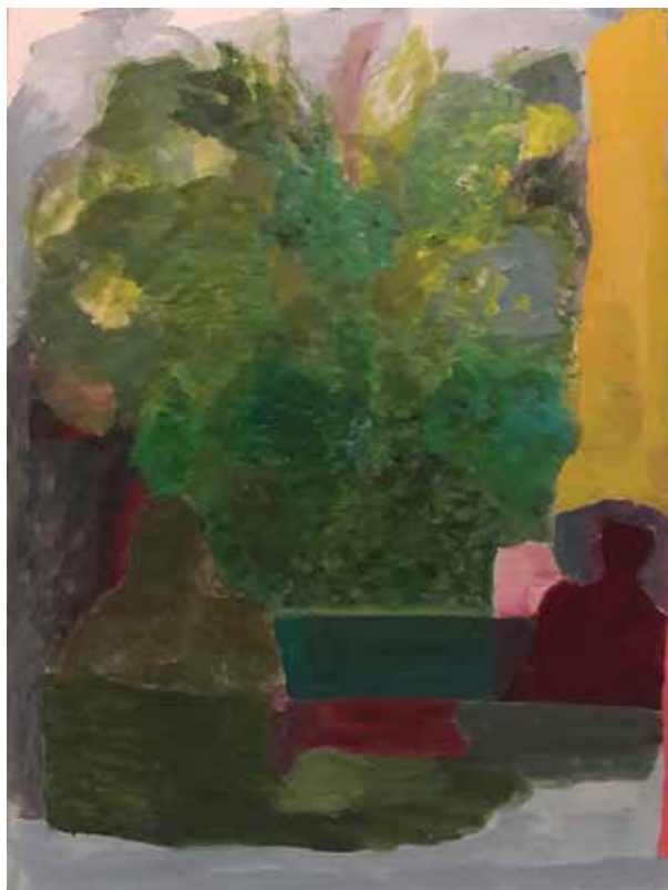
O VERDE FORA 2018 óleo sobre tela 80 x 60cm

Artista plástica com mais de 40 anos de prática artística, graduada em artes plásticas na FAAP. Estudou na New School of Arts em New York; Escola Brasil; fez cursos com Hélio Cabral, Nelson Nóbrega e com Paulo Pasta. Exposições individuais no SESC Pompéia, Galeria Prado, Galeria da Aliança Francesa, Pinacoteca do Estado, Casa Contemporânea e Centro Histórico do Makenzie. Exposições Coletivas foram ao todo 45, sendo as principais no MASP, Pinacoteca do Estado, MuseuAfro, Biblioteca Mário de Andrade e Galeria Virgílio. Desenvolveu curadorias para o SESC São Carlos, SESC Santana e Museu da Casa Brasileira. Tem também 03 livros publicados: PINHAL: Receitas e Estórias de família; ÓCIO: obras de Helena e poesia de Manoel de Barros; PULO DO GATO: Esculturas.