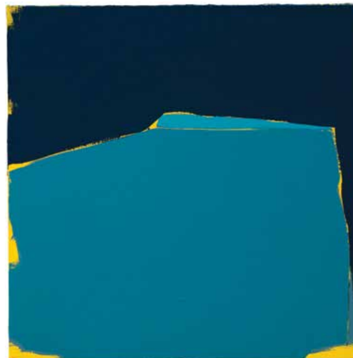
SEM TÍTULO 001 2019 Acrílica em tela 40x40x2cm

contato@edusilva.art.br | 11 999 138 044 www.edusilva.art.br