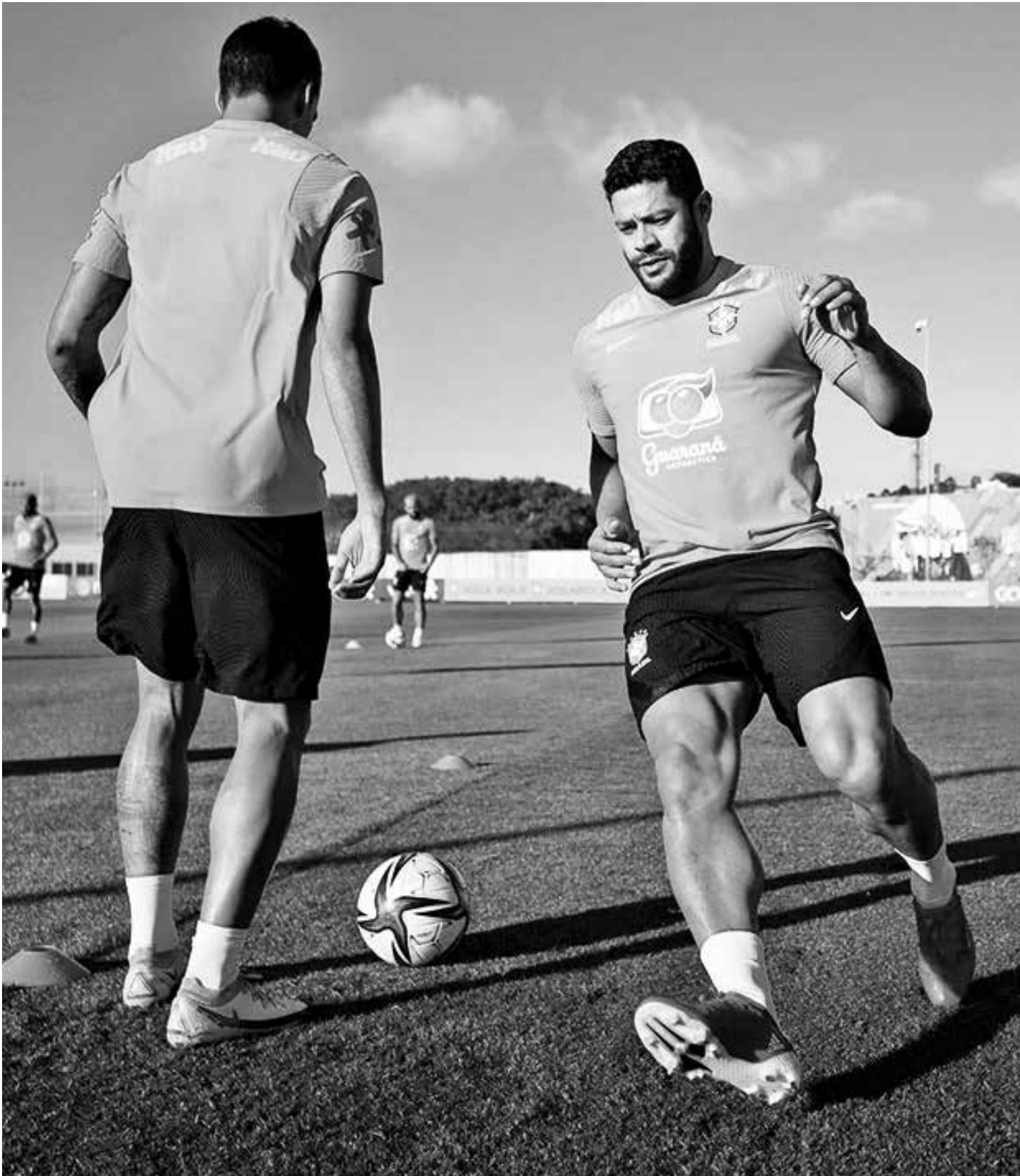
O paraibano Hulk nos treinamentos realizados na Granja Comary visando os três jogos válidos pelas Eliminatórias contra o Chile, Argentina e Peru

A Seleção tem 18 pontos e o quinto colocado apenas oito. A rodada desta quinta-feira programa mais quatro jogos.