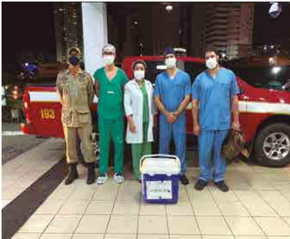
À esquerda, equipe que retomou os transplantes de coração na Paraíba e, à direita, profissionais da Central Estadual de Transplantes em ação na captação de doação de córneas

Em relação às córneas, foram registradas 32 doações, entre o dia 1º e o último dia do mês. Desse número, 14 foram doadas em João Pessoa e 18 em Campina Grande, que pela primeira vez ultrapassou os dados da capital.