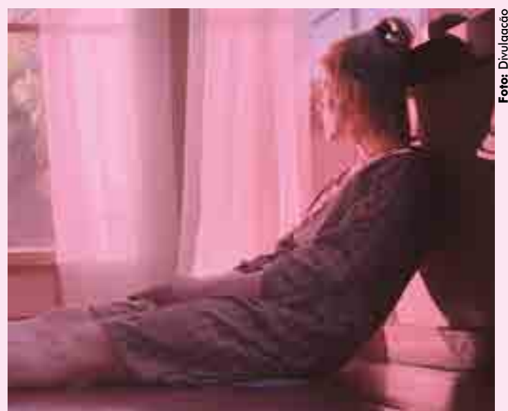
Filmado antes da pandemia, longa-metragem mostra uma nuvem tóxica que surge em diversos países, forçando todos a ficarem confinados

O filme marca a estreia na direção de Iuli Gerbase, que já assinou seis curtas-metragens selecionados para diversos festivais internacionais como TIFF e Havana Film Festival.