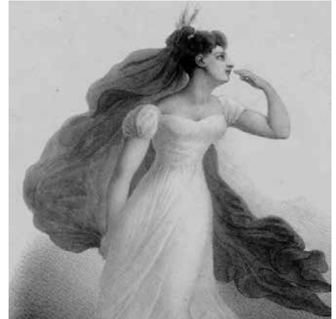
Atriz irlandesa Harriet Smithson (1800-1854) como Ofélia em 'Hamlet'